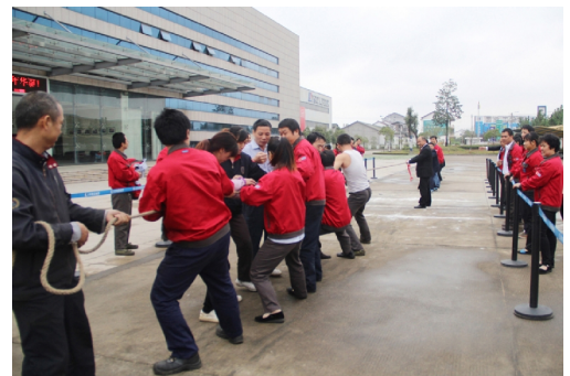
江西变电设备有限公司员工拔河比赛现场

质量，通过研发节能环保、绿色低碳的光伏太阳能发电用箱式变电站、美式新能源箱变等新产品，对非晶合金SH15干式变压器、立体卷铁芯变压器产品进行试制和批量化生产，从今年九月份以来订单量连续猛增，为江变公司开拓新能源市场、占领更多市场份额奠定基础，为进军更广阔的供电领域做好了准备。