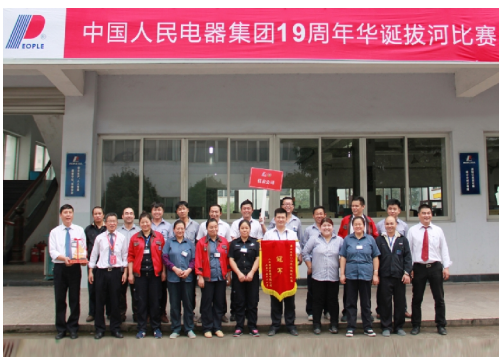
人民电器集团19周年华诞拔河比赛冠军团队

11月18日，人民电器集团浙江温州、江西南昌、上海嘉定、江西抚州四大制造基地同时举行隆重而又热闹的庆典活动，共同庆祝中国人民电器集团成立十九周年。