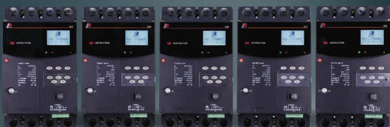
RDM5Z系列塑壳智能式断路器

概述: 中国人民电器集团研发的 RDM5Z 系列塑壳智能式断路器是集欠压、过压保护、过电流保护、短路保护、剩余电流保护、在线实时监测显示、可选择自动重合闸、RS-485 通讯、DI/O 可编程远程控制分合闸、多条故障记录查询、512 次以上剩余电流运行记录、断路器运行数据记录、实时远程数据监测等功能于一身的综合型剩余电流保护断路器。产品特别适合城乡电网用于三相四线中性点直接接地的低压电网系统、用来对人身触电危险提供间接接触保护,也可对线路或用电设备的接地故障、过电流、短路、过欠压等进行保护。