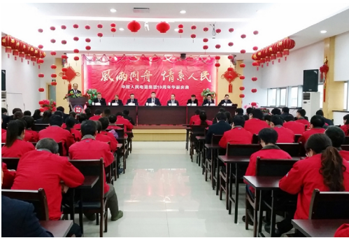
江西变电设备有限公司庆祝集团十九周年华诞