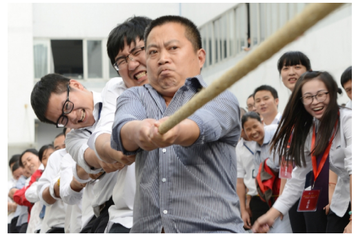
人民电器集团19周年华诞拔河比赛现场

2015年，上海公司加快加速创新转型，持续做精做专产业，发挥品牌优势作用，深化科学发展观念，全体员工拼搏向上，充分发掘企业内部潜力，增强竞争力，促进了企业的长远发展。公司自主创新的智能电网卫星网络传输系统成功上市，抢占了市场先机，取得了重大技术突破，取得了优异的销售成绩。