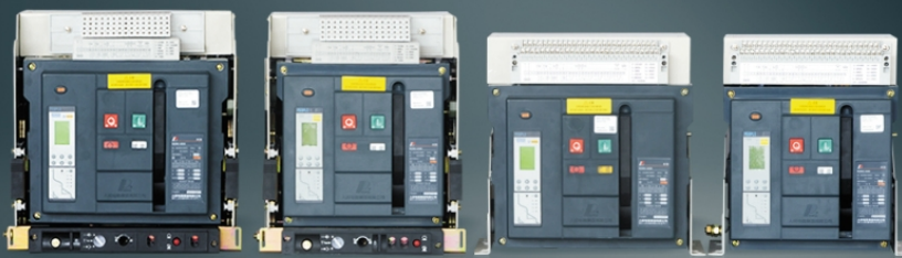
RDW2智能万能式断路器

概述: 中国人民电器集团研发的 RD 系列高低压电器向智能化、数字化、模块化、多功能化和小型化方向发展,产品自带通讯接口能应用于各种现场总线,实现了配电系统的远程遥控、遥测、遥调、通讯功能,是智能智慧产品。RDW2 智能万能式断路器用来分配电能和保护线路及电源设备免受过载、欠电压、短路、单相接地(漏电)等故障的危害。断路器具有智能化保护功能,选择性保护精确,能提高供电可靠性,避免不必要的停电。同时带有开放式通讯接口,便于与现场总线连接,可实现“四遥”功能,以满足控制中心和自动化系统的要求。