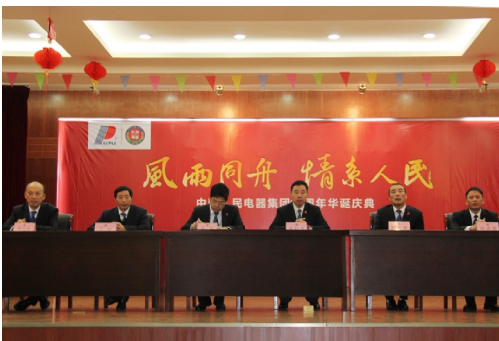
江西人民输变电公司庆祝集团十九周年华诞