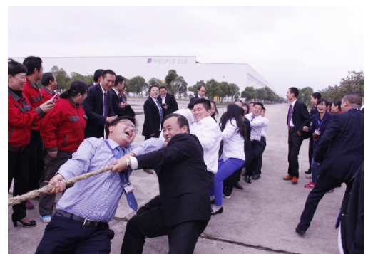
江西人民输变电公司员工拔河比赛现场

改革的方向，在市场开拓方面将继续完善市场创新模式；在技术创新新产品开发和老产品改造双管齐下；在文化领域加强品牌的宣传推广力度，让“人民电器，为人民服务”的企业价值观深入人心；在社会公益和生态文明建设上，坚持走低碳环保的可持续发展模式，为社会的发展奉献“人民”的力量。