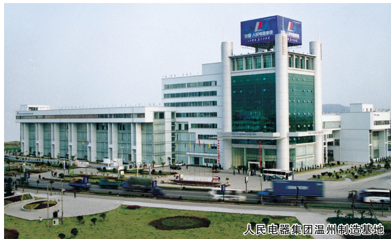
人民电器集团温州制造基地

除了东盟外，该集团还在中东、东南亚创建了 20 多家销售分公司。去年 5 月，人民电器集团授权沙特独家代理公司签约仪式举行，该公司拟每年从人民电器集团采购一个亿以上的业务量。