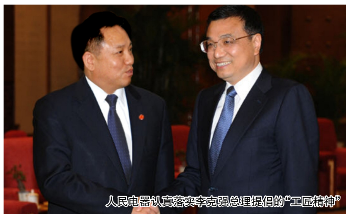
人民电器认真落实李克强总理提倡的“工匠精神”

郑元豹凭着他的影响力，先后当选人大代表、政协委员和全国工商联执委，荣获全国优秀企业家等荣誉称号，担任多种社会职务如省民营经济协会副会长、浙江电气行业协会会长。