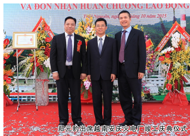
郑元豹出席越南安火电厂竣工庆典仪式