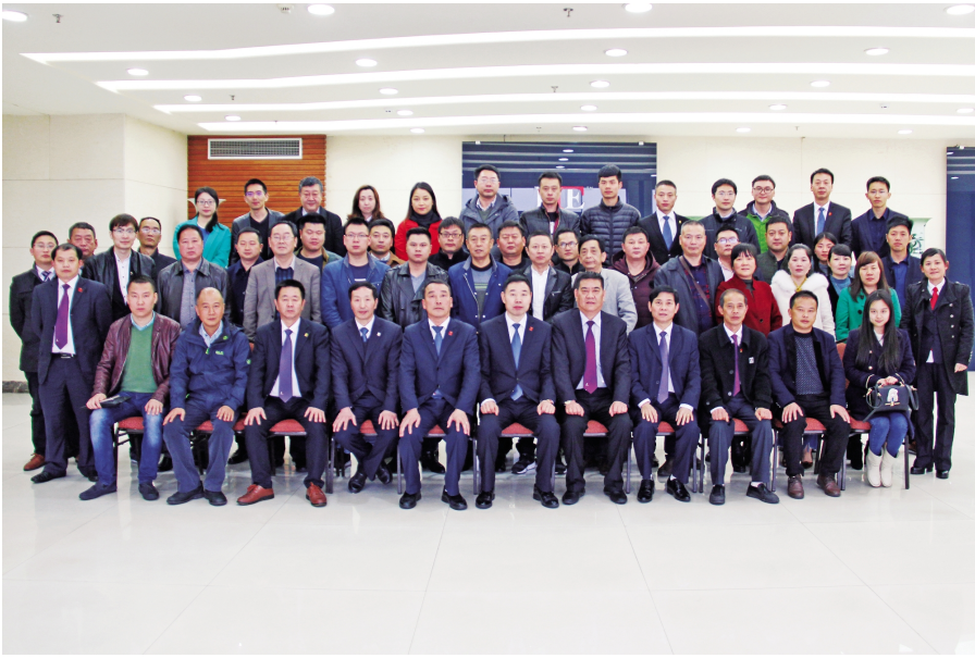
本报讯 三月春风和煦气爽、万物复苏生机盎然，2017年3月18日，人民电器集团江西公司在南昌召开“供应商合作战略研讨会”。来自全国各地的供应