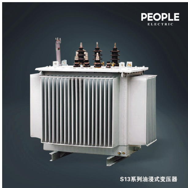
S13系列油浸式变压器

优良的产品美誉长传,江西变电设备公司不忘初心,持续为世界人民提供高质量和高技术含量的电力产品。