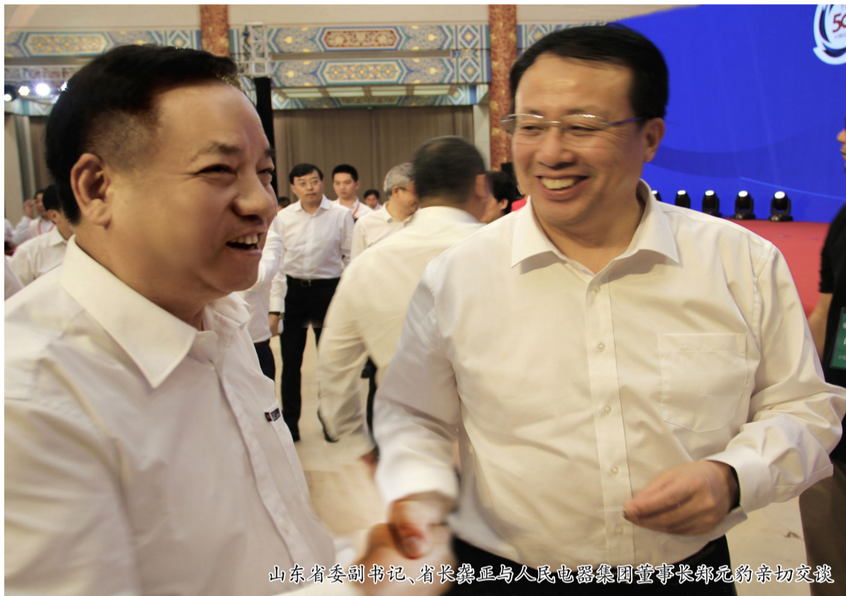
山东省委书记、省长龚正与人民电器集团董事长郑元豹亲切交谈

本报讯 8月24日，“2017中国民营企业500强发布暨民营经济发展峰会”在济南举行，集团董事长郑元豹应邀到会，并参加相关重要活动。