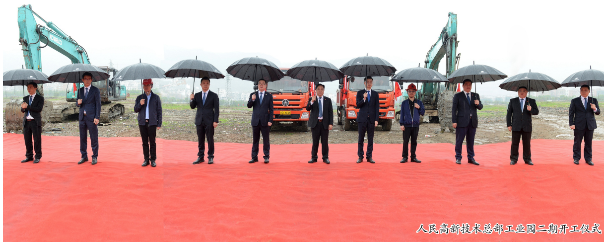
人民高新技术总部工业园二期开工仪式

本报讯 春雨润万物,人民谱新图。4月4日上午,伴随着贵如油的沥沥春雨,人民高新技术总部工业园二期项目开工仪式在柳市湖横隆重举行。