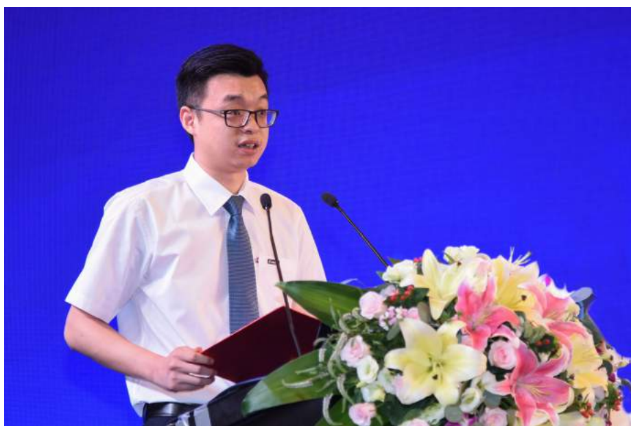
(上接第一版)智能·全产业链解决方案

作为民营企业的“娘家”，市工商联将围绕新时代“两个健康”先行区创建，重点在清廉教育、清廉文化、清廉机制、清廉基因、清廉导向、清廉基地六大领域发力，构建亲清新型政商关系。